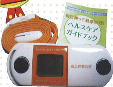
ペンダント型体脂肪計