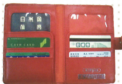
保険証・パスポートケース